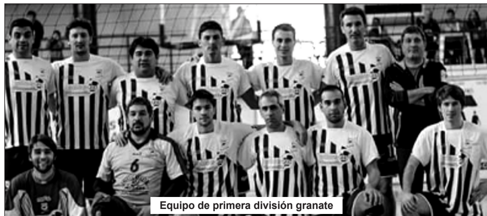
Equipo de primera división granate

ley. Disputada la fase regular se jugaron los partidos de cuartos, semis y finales. Copa de Oro: Cuartos de final: All Inclusive 2 – Náutico B 0, Defensores CH 1 – Provincial 2, Defensores VR 0 – Argentino 2 y Náutico A 2 – Gimnasia 0. Semifinales: All Inclusive 2 – Náutico B 0 y Argentino 2 – Náutico A 0. - Final: Argentino 2 – All Inclusive 1. - Copa de Plata: Semifinales: Defensores CH 2 – Provincial 0 y Defensores VR 0 – Gimnasia 2. Final: Defensores CH 0 – Gimnasia 2.