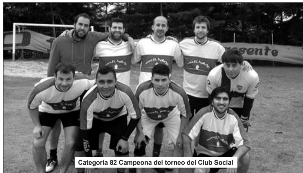
Categoría 82 Campeona del torneo del Club Social

UAI Urquiza se posiciona en la tercera ubicación de equipos más ganadores, detrás de Boca y River.