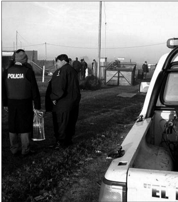
cipó DDI local, Patrulla Rural, Comisaría Segunda y el Grupo de Apoyo Departamental.

La investigación realizada por el Gabinete de Prevención de la Comisaría Primera junto a la DDI desembocó en estos seis operativos en los que también parti-