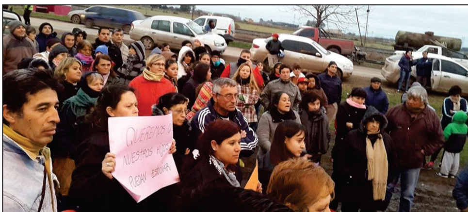
Una multitud pidió por seguridad y gestión a las autoridades municipales y policiales.