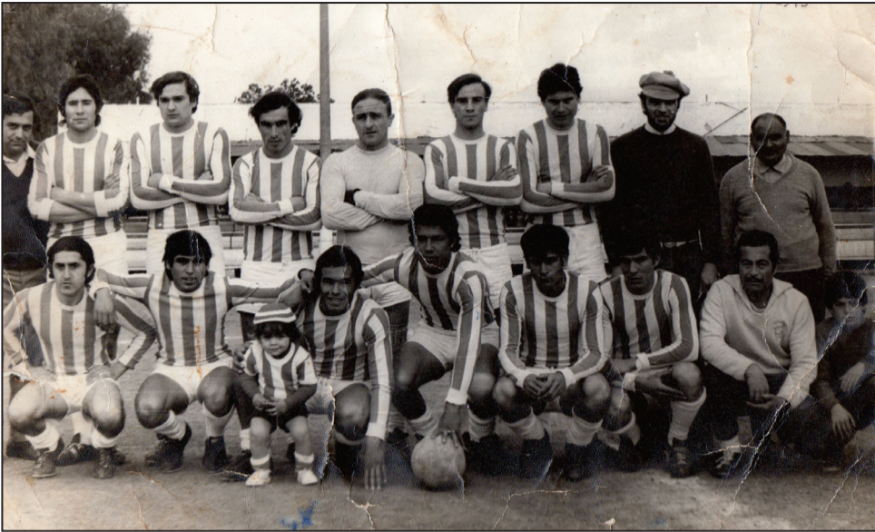
SOCIAL PARANÁ: Equipo Campeón del Torneo Preparación de la Liga Nicoleña de fútbol (1973).